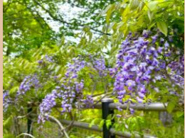
科名：マメ科 場所：藤棚池周り

万葉集の当時から鑑賞されてきた美しいフジ。見頃を迎え藤棚は素敵な香りに包まれています。