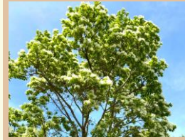
科名：モクセイ科 場所：長池エントランス付近

別名「ナンジャモンジャの木」とも呼ばれ華やかな白い小花をたくさん咲かせます。「雪の花」とも呼ばれます。