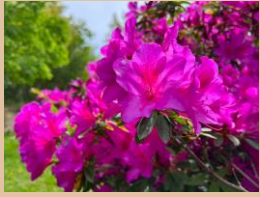
科名：ツツジ科 場所：園内各所

濃いピンク、薄いピンク、白の大きな花々が一面に咲く姿はびっくりするほど綺麗です。