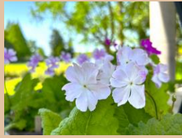
科名：サクラソウ科 場所：とんぼテラス前

準絶滅危惧種に指定されている貴重な植物サクラソウ。とんぼテラス前で様々な品種のサクラソウを展示中です。