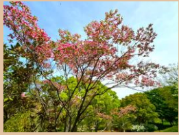
科名：ミズキ科 場所：園内各所

北米原産で別名「アメリカヤマボウシ」とも呼ばれ、アメリカを代表する花のひとつです。