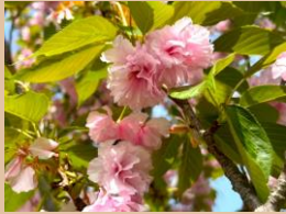
科名：バラ科 場所：流れの広場

花びらが豪華な八重のサクラが水辺の広場で満開です。何重にも重なった花びらはバラのように美しい姿です。