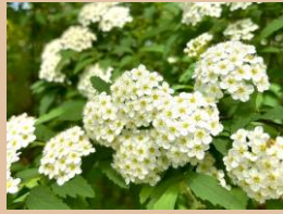
科名：バラ科 場所：水仙郷 園内各所