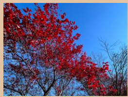
科名：バラ科 場所：花木園

年間を通して赤紫色の葉がとても美しく、秋にはさらに赤く色づいて見事な紅葉を楽しめます。