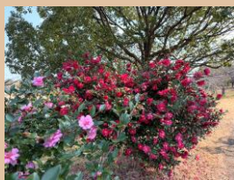
科名：ツバキ科 場所：水仙郷 園内各所

晩秋から咲き続ける花として親しまれるサザンカは日本の固有種です。花びらがぼらけて散る姿が可憐です。