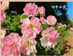
科名：バラ科 場所：バラ園

まだまだ綺麗な秋バラですが、今月末頃には摘花し、皆様へのプレゼントとさせていただきます。楽しみにお待ち下さい。