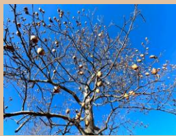
科名：モクレン科 場所：花木園

すっかり葉を落としたドライフラワーのような実と果実だけが残ります。風に吹かれて種子を遠くへ飛ばします。