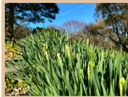
科名：ヒガンバナ科 場所：水仙郷

咲き誇る60,000株のスイセン。見ごろは1月上旬～2月中旬ごろの見込みです。開花が始まりました。