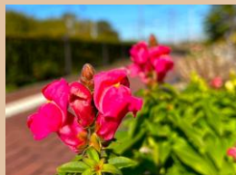
場所：管理事務所手前

第2・第3駐車場から管理事務所へ向かう道中、交差点のすぐ側でご来園される方をお迎えしています。