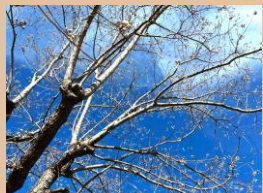
科名：トウダイグサ科 場所：園内各所

緑色の実が秋になると黒く熟し、表皮が割れ落ちると中から白いポップコーンのような実が現れます。