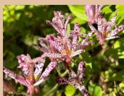
科名：ユリ科 場所：あじさい園

花卉の斑点が鳥のホトトギスの胸の模様に似ていることから名づけられました。色も形も不思議ですね。