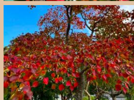
科名：トウダイグサ科 場所：スポーツハウス周り

ハート形の葉は赤や朱色に染まり、秋をより感じる感動的に美しい色付きです。小さな白い実も素敵です。