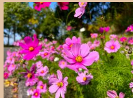
科名：キク科 場所：大池園路

大池園路約150mにも及ぶコスモスロードは、風に揺れる可憐な花をたくさんご覧いただけます。