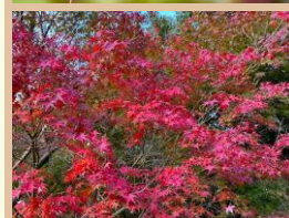
科名：ムクロジ科 場所：かえで池付近

秋が深まり黄色からオレンジ、深紅に移り変わっていく様子には、思わず目を奪われます！