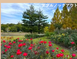
科名：バラ科 場所：バラ園

秋バラは昼夜の寒暖差の影響で、深みのある発色になります。11月に入り豪華なバラがどんどん咲き始めました。