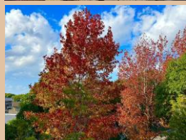
科名：マンサク科 場所：球技広場周り

別名はモミジバフウ、モミジに似た葉が美しく紅葉しています。大きく育った木々が圧巻です。