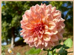
科名：キク科 場所：ダリアの広場・大池園路

秋のダリアが綺麗です。ダリアの広場では只今見頃を迎え、ステキな花浮かべも始まりました。(週末のみ)