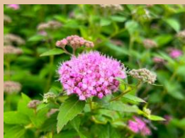
科名：バラ科 場所：水辺の広場

名前は下野国(しもつけのくに：現在の栃木県)ではじめて見つけられたところ由来します。