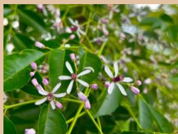
科名：センダン科 場所：水辺の広場 園内各所

しなやかな枝に香りのよい薄紫色の面白い形の花がたくさん咲き、花も実も美しい樹木です。