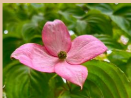
科名：ミズキ科 場所：花木園 大滑り台上側

園内にはシロバナヤマボウシとベニバナヤマボウシがあり、今の季節、長く楽しむことができます。