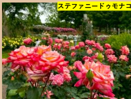
ステファニードゥモナコ