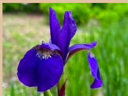
科名：アヤメ科 場所：あじさい園