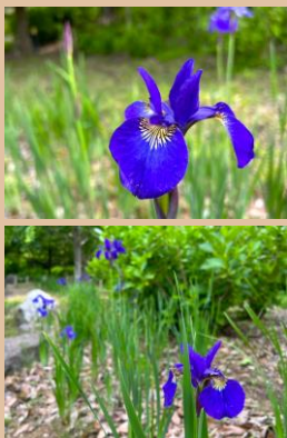
科名：アヤメ科 場所：あじさい園