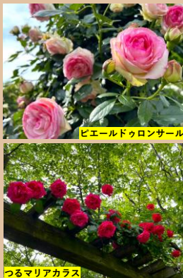
科名：バラ科 場所：バラ園