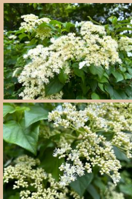
科名：アジサイ科 場所：あじさい園

木や岩に気根と呼ばれる根を張り成長し、巻きつかれた木に花が咲いたように見えます。