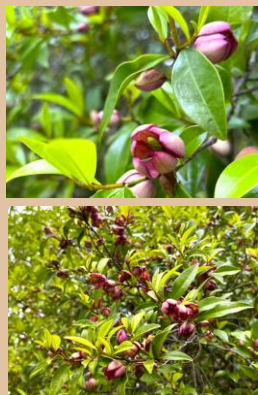
科名：モクレン科 場所：花木園