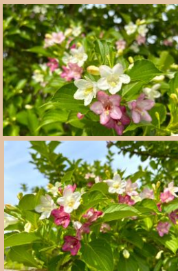
科名：タニウツギ科 場所：長池のエントランス付近

咲き始めの花は白ですが、順次、薄ピンク、紅色と三段階に移り変わる不思議な花です。