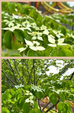
科名：ミズキ科 場所：大ずり台の上