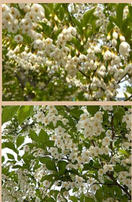
科名：エゴノキ科 場所：長池のエントランス付近

白い小花が下を向いて鈴なりに咲く姿が目を引きます。満開を迎え真っ白に輝いています。