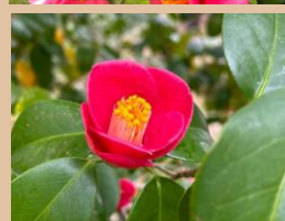
科名：ツバキ科 場所：花木園 水仙郷