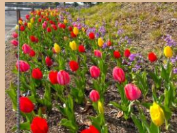
科名：ユリ科 場所：大池園路