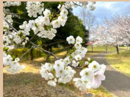
科名：バラ科 場所：花木園 園内各所

ソメイヨシノやカンヒザクラ、オオシマザクラが満開です。まだまだ様々な種類が次々に開花します。