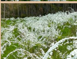
科名：バラ科 場所：園内各所