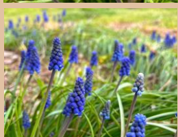
科名：キジカクシ科 場所：水と緑の音楽広場

小さな釣鐘型の花を房状につけて春の花壇を彩ります。水と緑の音楽広場で群生しています。