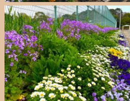
場所：管理事務所手前・スポーツハウス周り