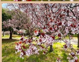
科名：バラ科 場所：花木園