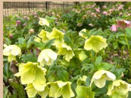
科名：キンポウゲ科 場所：あじさい園