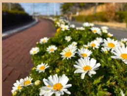
場所：管理事務所手前

第2・第3駐車場から管理事務所へ向かう道中、交差点のすぐ側でご来園される方をお迎えしています。