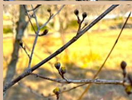
科名：ミズキ科 場所：花木園

葉が開くより先に開花し株全体が鮮やかな黄色に包まれます。固い蕾かたはほんの少し花弁がのぞいています。