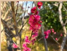
科名：バラ科 場所：花木園 第一駐車場入口