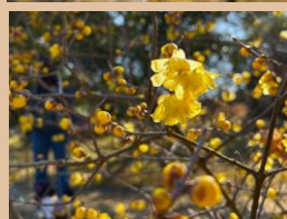
科名：ロウバイ科 場所：花木園