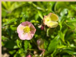
科名：キンポウゲ科 場所：あじさい園