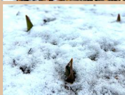
科名：ユリ科 場所：大池沿路

昨年の12月初旬に植え付けたチューリップが顔を出し始めました。開花予定は3月末頃です。