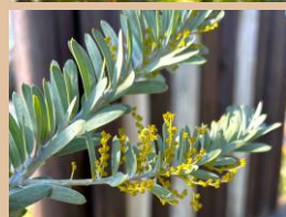
科名：マメ科 場所：花木園 入口花壇

黄色い小さなボールのような可愛い蕾をたくさん見る事が出来ます。開花が楽しみです。