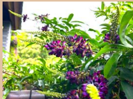
科名：マメ科 場所：藤棚池周り