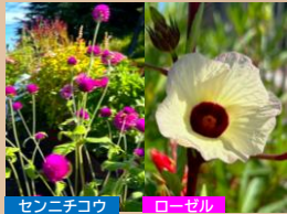
場所：管理事務所手前

交差点のすぐ側にある花壇です。たくさんの蝶が飛び交い、花々は暑さの中でも元気です。