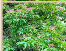
科名：ミズキ科 場所：藤棚池