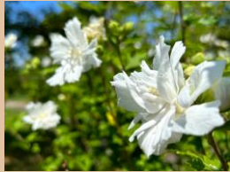
科名：アオイ科 場所：花木園

暑さで人や植物が元気のなくなる季節に、大きな花を咲かせる盛夏を彩る代表的な花木です。